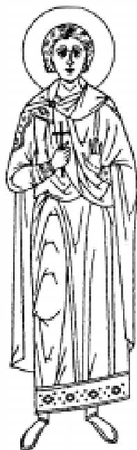
Св. мч. Вонифатий